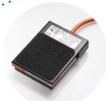
Commande à pédale