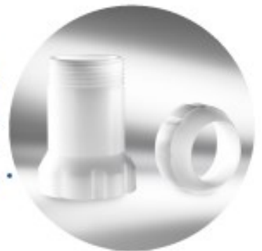
Deux douilles rondes de série, d'autres formes de douilles sont disponibles sur demande

Des cylindres supplémentaires peuvent être achetés sur demande.