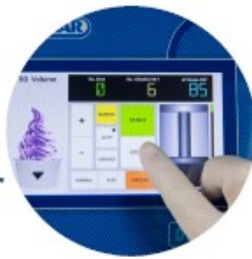
Écran d'affichage LCD 7"

Ecran de contrôle pour une utilisation simple et rapide (inclus : un didacticiel vidéo)