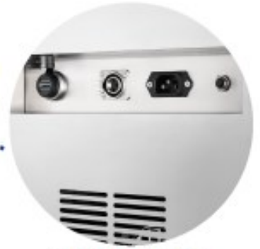
Téléchargement automatique de l'historique sur USB

Ecran de contrôle pour une utilisation simple et rapide (inclus : un didacticiel vidéo)